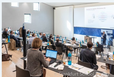
Keynote-Vorträge & Diskussionsrunden