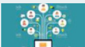
Call for participation

Masterstudierende & NextGen geben Einblick in ihre Vorstellung zu Future of Work