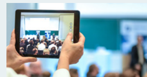
The VOICE of the NEXT GENERATION

Inspirationsboard, Icebreaker Games, VR-Brille, Pepper und weitere Überraschungen